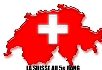
LA SUISSE AU 5 e RANG

24 avril : présentation du Classement mondial de la liberté de la presse à Lausanne dans les locaux du Temps. La Suisse figure au 5 e rang.