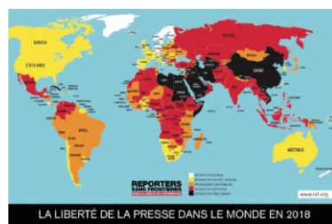
LA LIBERTÉ DE LA PRESSE DANS LE MONDE EN 2018

3 mai : présentation du Classement mondial de la liberté de la presse à Lugano et à Zurich.