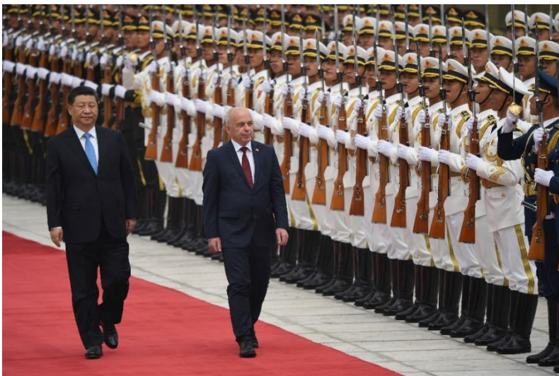
Le président de la Confédération Ueli Maurer et son homologue chinois Xi Jin Ping en avril 2019 à Pékin lors de la rencontre des deux chefs d'Etat.

conjointe de 36 Etats déposée au Conseil des droits de l'homme, en mars 2019, demandant à Ryiad de coopérer aux investigations internationales sur l'assassinat sordide du journaliste Jamal Khashoggi et de libérer les journalistes arbitrairement détenus par le régime. RSF Suisse y priait le Conseil fédéral de « s'engager clairement et activement en faveur de la liberté d'information ainsi que de la sécurité et de l'intégrité des journalistes dans tous les contacts, missions et voyages à l'étranger ». Notre organisation critiquait en outre le fait qu'à la faveur de la visite en Chine du président de la Confédération Ueli Maurer, une déclaration d'intention ait