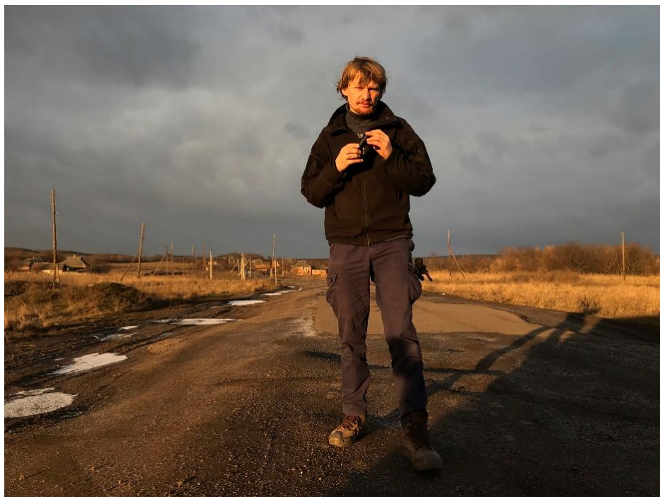
Le photoreporter ukrainien Maks Levin, tué fin mars par les troupes russes

ouvert un premier « Centre pour la liberté de la presse » à Lviv puis un second à Kiev dès que la situation l'a permis. Ce centre a pu distribuer du matériel de protection (casques, gilets pare-balles), offrir des conseils, de l'assistance et de la formation continue sur le journalisme en temps de guerre.